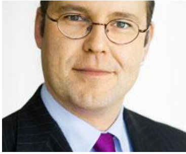
Anders Borg

Die schwedische Wirtschaft entwickelt sich äußerst positiv, der wirtschaftliche Aufschwung ist auf breiter Front spürbar.