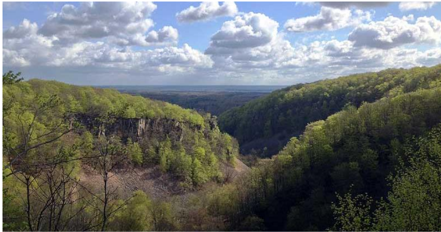
Der Aussichtspunkt Kopparhatten.

Die Landschaft Skåne (Schonen) hat den Ruf, ein ziemlich plattes Land zu sein. Aber wer auf Schusters Rappen in der südschwedischen Region unterwegs ist, wird eines anderen belehrt. Teile des Wanderweges Skåneleden, die von Åstorp Richtung Höör quer durch die Landschaft verlaufen, bieten abwechslungsreiches Terrain. Hier wandert man am Fuße des Bergs Söderåsen, durchstreift mächtige Buchenwälder, findet Schluchten und Aussichtspunkte in einer grünwogenden Landschaft. => „ Von Hügel zu Hügel “ ist das Motto der Strecke, die mit 14 Etappen für einen ganzen Wanderurlaub reicht!