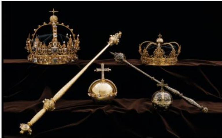
Bestattungsschmuck von Karl IX und Königin Kristina. Jetzt fehlen die Kronen und ein Reichsapfel.

Die Freude war groß, als die königlichen Juwelen in Åkersberga, nördlich von Stockholm, wiedergefunden wurden! Ein Wachmann schaute in einer unförmigen Plastiktüte, die zuoberst in einem Müllcontainer lag. Darin befanden sich die goldenen, juwelbesetzten Regalia aus dem 17. Jahrhundert: zwei Kronen und ein Reichsapfel, – unachtsam weggeworfen wie Schrott.