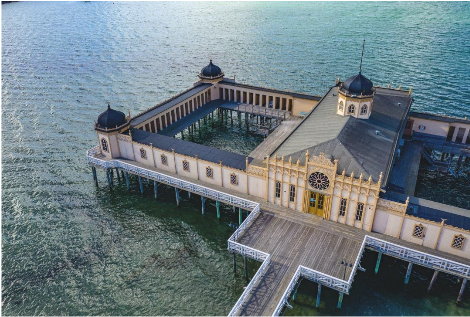
Kaltbadehaus in Varberg, Varberg

trotzdem lieber vom Ufer zuschaut, kommt aber auch auf seine Kosten, denn viele Kaltbadehäuser bestechen durch eine beeindruckende Architektur. Der schwedische Tourismusverein STF hat die fünf spektakulärsten Badehäuser gekürt.