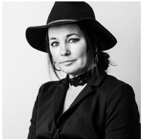
Sophie Zelmani, "Sunrise-Tour" am 16. Juni.

Die Popularität der schwedischen Singer Songwriterin mutet im Zeitalter der Dauer-Selbstdarstellung beinahe wie ein Anachronismus an: Obwohl die Direktheit ihrer Songs jede Grenze zwischen ihr und dem Publikum aufzuheben scheint, weiß man außerhalb der Musik nahezu nichts über die Privatperson Sophie Zelmani. Das wiederum ist nichts Neues, denn bereits seit sie 1995 mit ihrer Debutsingle Always You in ihrer Heimat "über Nacht" berühmt wurde, gelang es ihr, sich aus dem Scheinwerferlicht weitestgehend herauszuhalten und für einen Popstar ein von der Öffentlichkeit unbehelligtes Privatleben weiter führen zu können. Dennoch tat das ihrer Karriere keinerlei Abbruch, denn die meisten ihrer Alben schafften es in die schwedischen Top Five. Niemand versteht es besser, die dunklen Seiten der Liebe und des Lebens in gefühlvollen und melancholischen Songs zu beleuchten als Sophie Zelmani. Anfang 2019 veröffentlicht Sophie Zelmani ihr neues Studioalbum Sunrise und wird ihre Musik in gewohnt persönlicher,