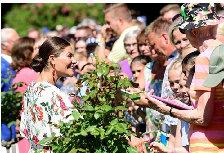
Kronprinsessan bland gratulanterna i Sollidens slottspark.

Am 14. Juli 2019 feierte Kronprinzessin Victoria ihren 42. Geburtstag. Wir wünschen ihr noch alles Gute nachträglich zum Geburtstag.