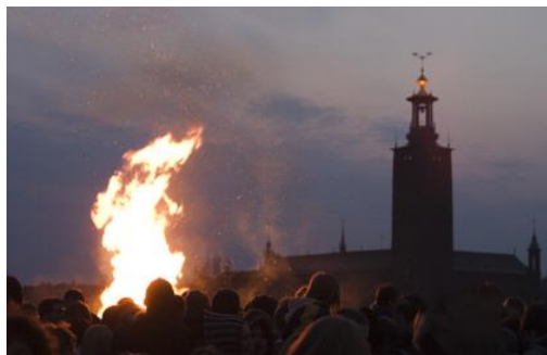
Walpurgis in Stockholm

Im Laufe eines Jahres sammelt sich eine ganze Menge Gerümpel an. Und auf den „Maihaufen“, wie er oft genannt wird, wirft man all das, was man loswerden will: alte Türen und Zäune, die Äste und Zweige vom Obstbaumschnitt, Sträucher und alte Kartons. Am letzten Tag im April zündet man die Feuer an.