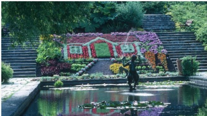
Ein schwedisches Sommerhaus, „gebaut“ aus Blumen. #gbgbotaniska

Unweigerlich hält der Frühling Einzug in Schweden, da heißt es „Hochsaison für Gartenfreunde“! Auch in den 12 botanischen Gärten des Landes arbeitet man auf Hochtouren, um die Sammlungen für die neue Saison fit zu machen. Zum alljährlichen Frühlingsritual gehören auch die „Bild-Rabatten“ im Botanischen Garten von Göteborg : Dabei werden Blumen und Grüngewächse so gesetzt, dass sie ein Motiv ergeben. Und jedes Jahr wird spekuliert, welches aktuelle Thema diesmal das Bilder-Beet bestimmt. Lesen mehr darüber hier .