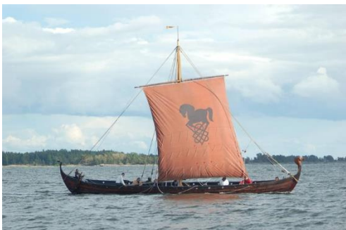
Das Wikingerschiff Glad am See Vänern, außerhalb des Wikingerzentrums von Värmland.